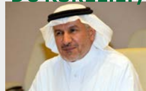
DR. ABDULLAH AL RABEEAH

«Le pont aérien de secours est mis en place sous la directive du Serviteur des deux Saintes Mosquées, le Roi Salmane bin Abdulaziz Al Saud, qui a chargé le KSrelief de fournir une aide médicale et humanitaire urgente pour soulager les souffrances du peuple libanais. La directive met en évidence le ferme engagement du Royaume d'Arabie Saoudite à la fourniture de l'aide humanitaire à toutes les personnes dans le besoin dans le monde en toute impartialité dans tous les secteurs humanitaires.»