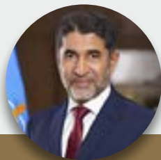
AHMAD AL MANDHARI

«Au nom de tous les enfants et familles qui ont pu être sauvés, je dis merci, et j'espère que nous continuerons d'être encore plus utile à l'avenir comme nous l'avons été dans ce partenariat.»